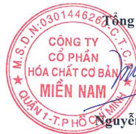
Nguyễn Hữu Thọ